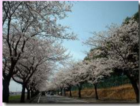
芳賀町・本田技研研究所の桜

からが楽しみです。氏家小学校も、もう少しで満開です。あちらこちらで花満開で楽しみです♪。